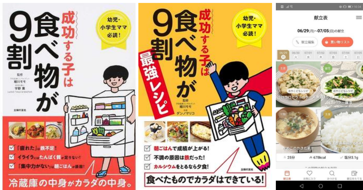
人気作『成功する子は食べ物が9割』シリーズのDX事業を開始

※）※企業がビジネス環境の激しい変化に対応し、データとデジタル技術を活用して、顧客や社会のニーズを基に、製品やサービス、ビジネスモデルを変革するとともに、業務そのものや、組織、プロセス、企業文化・風土を変革し、競争上の優位性を確立すること（経済産業省、DX 注目企業 2020 より引用）